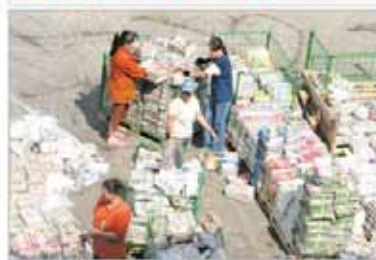
Presa din România: distribuție primitivă, constrângeri financiare și

Audio, video, scrisă ori online. Nu contează indiferent de forma sa, presa românească are, în anul de grație 2007, problema acută. Câteva dintre ele au fost scoase în evidență în volumul III din „Cartea albă a presei”, axat pe definirea dificultăților economice cu care se confruntă breasta.